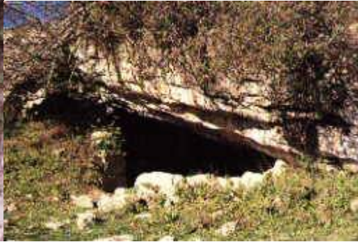
Una de las cuevas de las Peñas de los gitanos