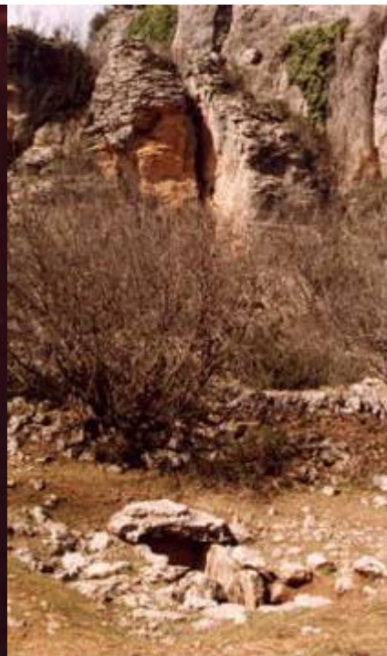
Fotos de dólmenes