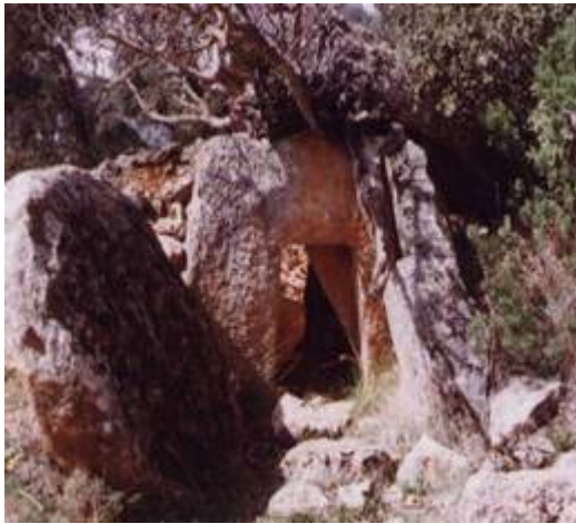
Dólmen cubierto de vegetación en Los Castillejos